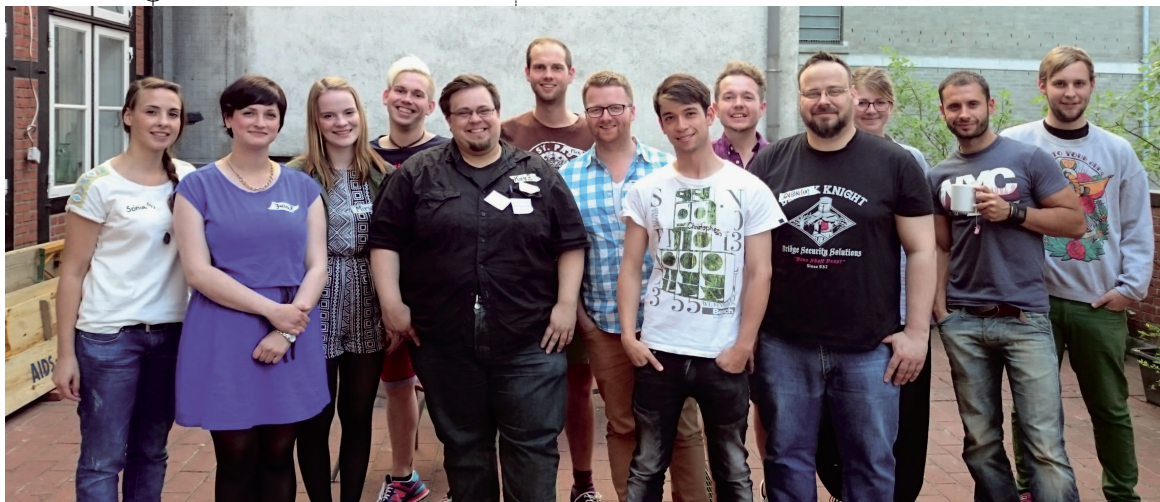
Das Youthworkteam der AIDS-Hilfe Hamburg